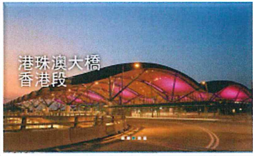
港珠澳大橋 香港段