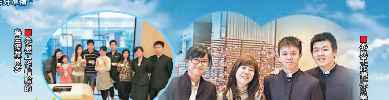
■參與工作體驗的學生與導師合照

師生積極參與商校合作計劃活動，參與學生均認為活動有助他們認識不同行業和工種，了解工商企業運作，不同行業對僱員的要求之餘，亦能提升其共通能力，增強自信。活動後學生往往能認清自己的興趣和升學就業方向，從導師身上學到許多珍貴的待人處世態度，建立正確的工作態度和價值觀，為規劃自己的未來作好準備。