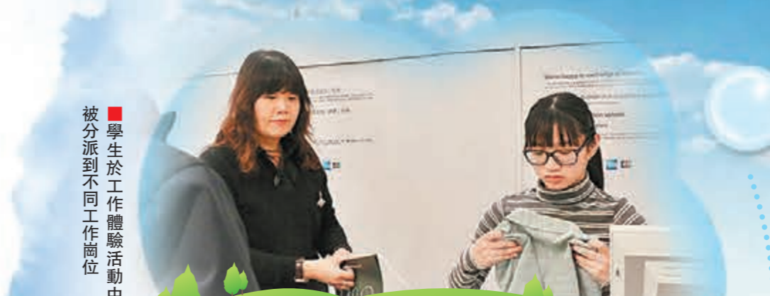
■學生在Mark's and Spencer零售業務工作體驗