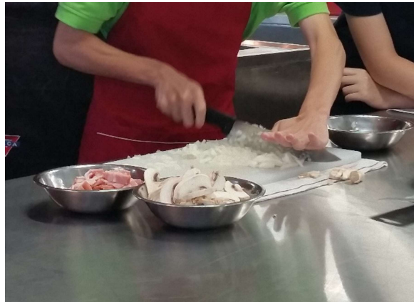
圖：學生在參與走訪過程中，了解到於行業發展是需要有一定的語文基礎，故需於中學時期作準備

由於有特殊學習困難的學生學業成績稍遜，令他們對讀書的動機減低，而且學生不明白學校當中所學的與將來工作或升學的關係，進一步令他們放棄中學的課程。如走訪能夠帶給他們對就業/升學的一個新角度，讓他們了解中學時期可以作的準備，便能鼓勵他們於某些學科上有所追求。此外，有些學生不懂得如何規劃自己的路向從而達至心中的目標。而走訪時透過負責人說明讀書與行業的關係及職場與院校中的所見所聞，讓他們知道自己現階段可怎樣預備，提升他們讀書的動機。