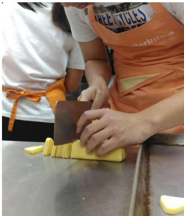
圖：學生於走訪過中實際體驗過程，了解到自己對該行業的喜惡

經驗分享2：該學生很喜歡玩電子遊戲，希望自己將來能做有關電腦的行業。導師與他到資訊科技公司走訪。於走訪期間，他發現資訊科技不單是「玩電腦」，更包括一些程式設計、硬件裝嵌的知識等，他便發現自己了解的電腦知識太渺小，如以電腦為自己的職業，他需要學習更專業的知識。